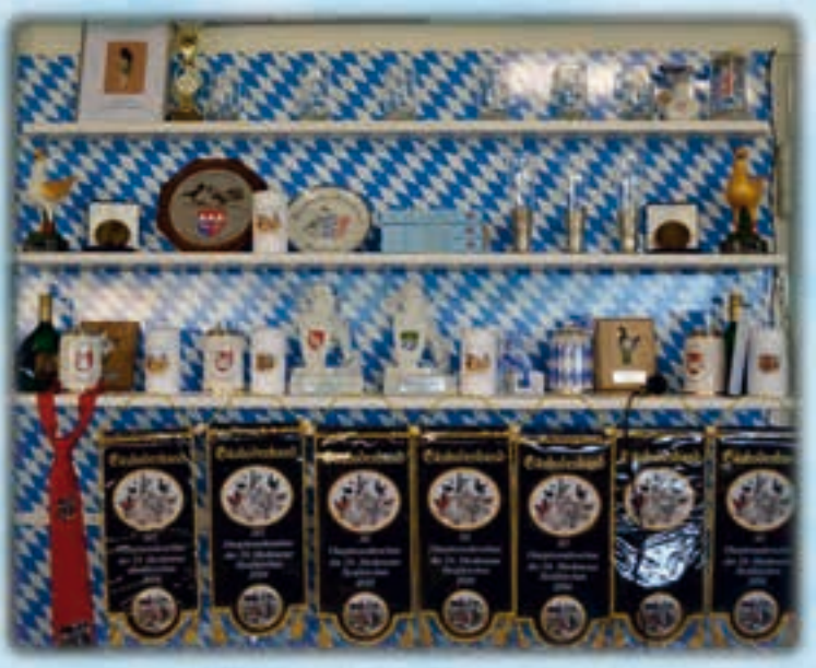
Wertvolle Preise warten auf die Aussteller

viele und aktive Züchter und erfolgreiche Aussteller