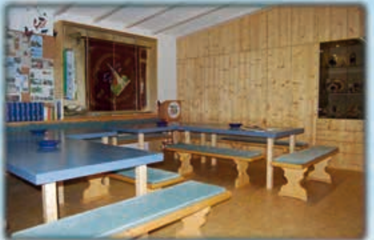
Unser Schmuckstück - das Taubererstüberl