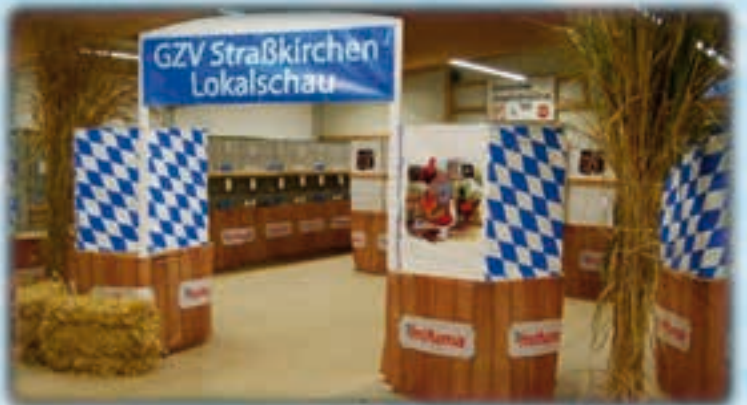
Die Ausschmückung „bayerisch-weiß-blau“

Die Gäubodenhalle Straßkirchen wurde im Jahre 1999 gemeinsam mit der Gemeinde Straßkirchen und dem ESC Straßkirchen errichtet. Seitdem wurden viele Ausstellungen bis hin zu Europaschauen veranstaltet.