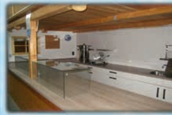
Unsere neue moderne Küche

Werde Mitglied im GZV Straßkirchen und Umgebung e.V. - gegründet 1970