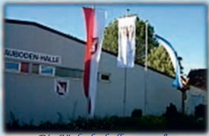
Die Gäubodenhalle von außen

Die Gäubodenhalle Straßkirchen wurde im Jahre 1999 gemeinsam mit der Gemeinde Straßkirchen und dem ESC Straßkirchen errichtet. Seitdem wurden viele Ausstellungen bis hin zu Europaschauen veranstaltet.